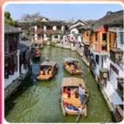
หมู่บ้านโบราณจูเจี๋ยเจี๋ย + ล่องเรือ