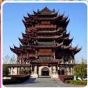
วัดดงหยวน