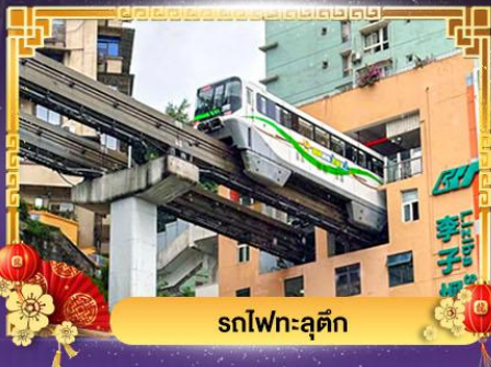
รถไฟฟ้า-ลู่ตัก