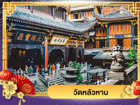
วัดหลิวหยาน