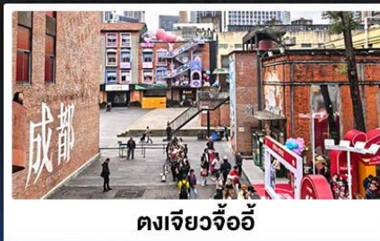
ตงเจียงจื้ออี้