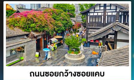
ถนนชอยกว้างชอยแคว