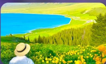
ทะเลสาบไซ่หลี่มู่