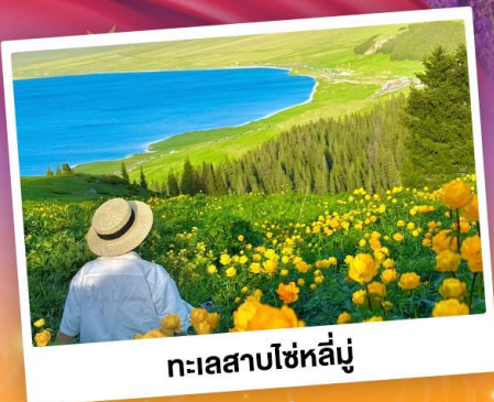
ทะเลสาบไซไห่หลู่