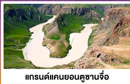
แกรนด์แคนยอนตูซานจื่อ