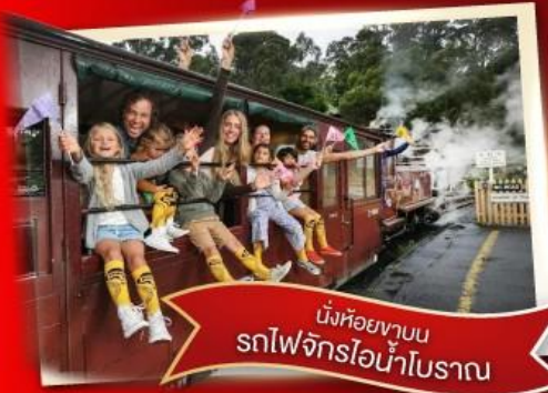
นั่งห้อยขาบน รถไฟจักรไอน้ำโบราณ