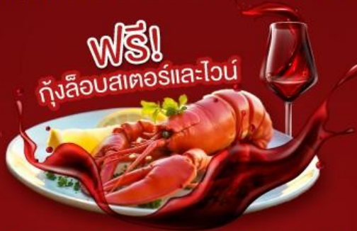
ฟรี! กุ้งล็อบสเตอร์และไวน์