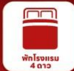
พักรูมแรม 4 คืน