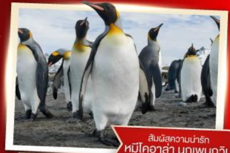
สัมผัสความน่ารัก หมีโคอาล่า นกเพนกวิน