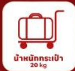
น้ำหนักกระเป๋า 20 kg