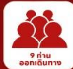
9 ท่าน ออกเดินทาง