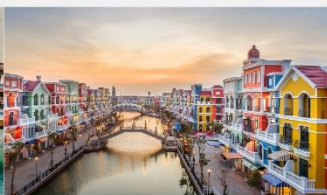
แกรนด์เวิลด์ฟูทิว๊ก