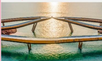
สะพานจูปิเตอร์