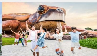
วินเพิร์ล อควาเรียม

*ทางบริษัทฯ ขอสงวนสิทธิ์ในการสลับโปรแกรมทัวร์ตามความเหมาะสมขึ้นอยู่กับสถานการณ์หน้างาน โดยคำนึงถึงผลประโยชน์ของลูกค้าเป็นสำคัญ