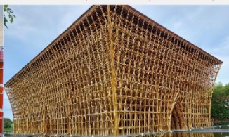
บ้านไม้ไฟ