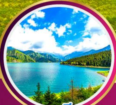
ทะเลสาบเทียนชาน