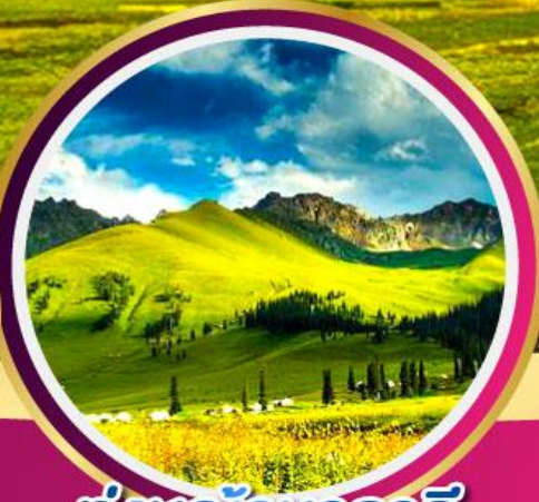
ทุ่งหญ้านาลาตี