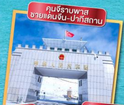
คุณจิราบพาส ชายแดนจีน-ปากีสถาน