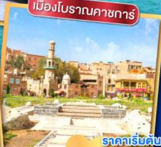
เมืองโบราณคาชการ์