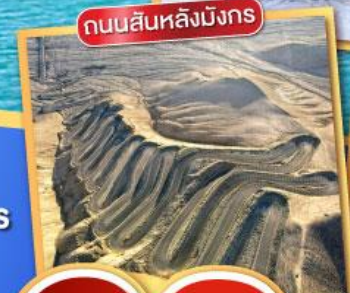
ถนนสีหลังมังกร