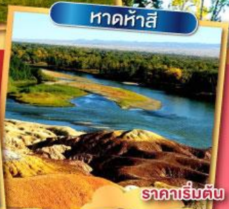
หาดห้าสี