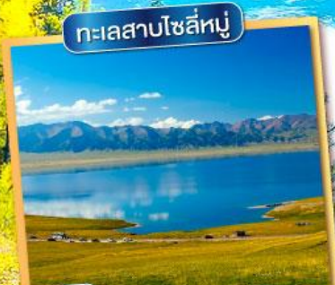
ทะเลสาบไซลีทู่

ประกันสุขภาพและอุบัติเหตุ คุ้มครองสูงสุด 3,000,000 *จำนวนคุ้มครองเป็นไปตามกรมธรรม์ประกันภัย