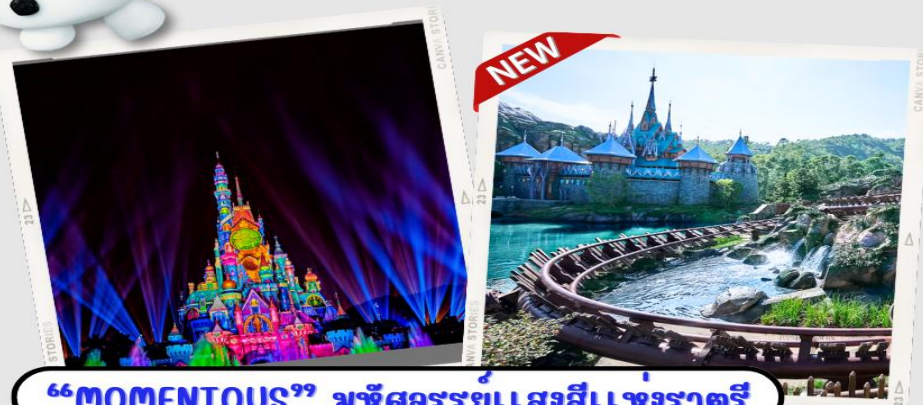
“MOMENTOUS” มหึศจรรย์ขบวนแสงสีแห่งราตรี