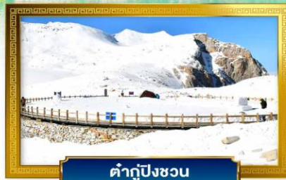
คำกู่ปิงชวอ