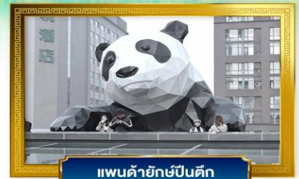
แพนด้ายักษ์ปิ่นตึก