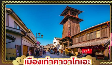
เมืองเก่าคาวาโกเอะ