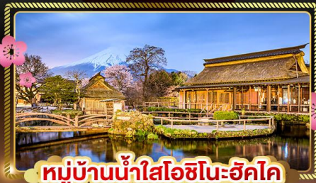
หมู่บ้านน้ำใสโอชิโนะฮัคโค