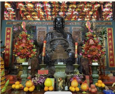
วัดปึกโต