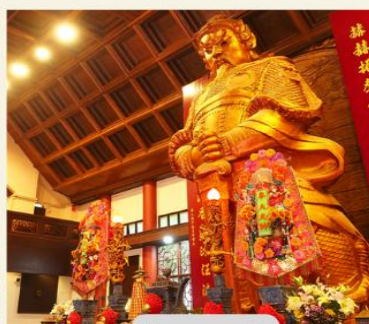
วัดเขากงหมิว