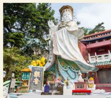
เจ้าแม่กวนอิมหาดรีพัลส์เบย์