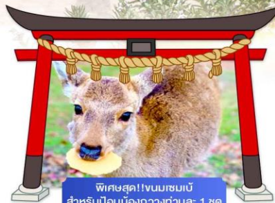
พิเศษสุด!!ชมเมฆเมเปิ้ล สำหรับป้อนน้องทิวทัศน์ค่าเช่า: 1 ชุด