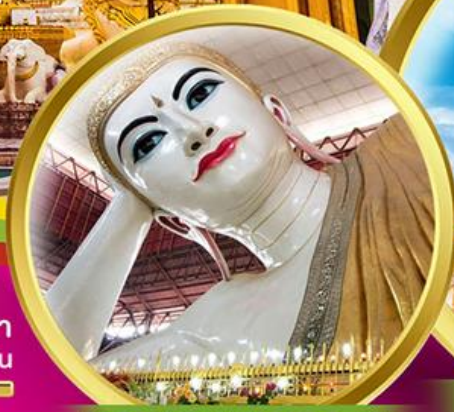
พระนอนตาทวน