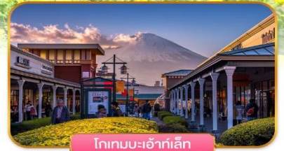
โกเทมบะเฮ้าท์เล็ท