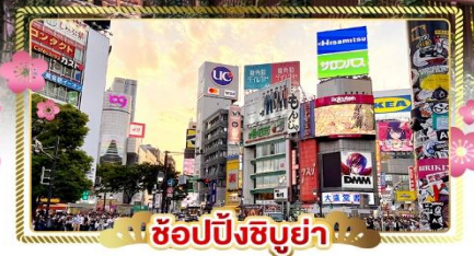
ชิโอบังชิบูย่า