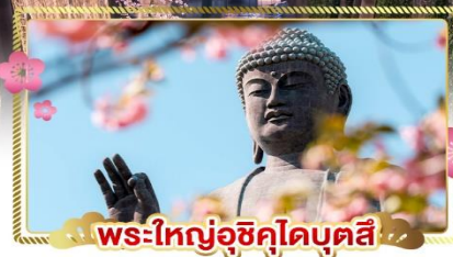
พระใหญ่อุซึคุโอบุคซึ