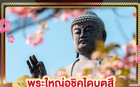
พระใหญ่อุซึคุโดบุตสึ