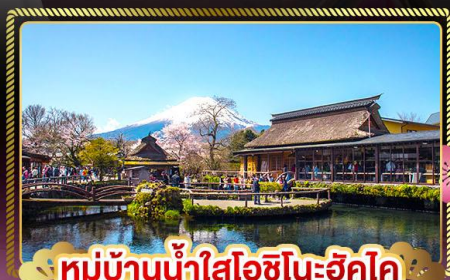
หมู่บ้านน้ำใสโอชิโนะฮัทโค