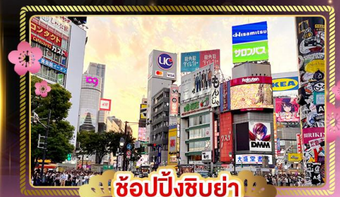
ช้อปปิ้งชิบูย่า