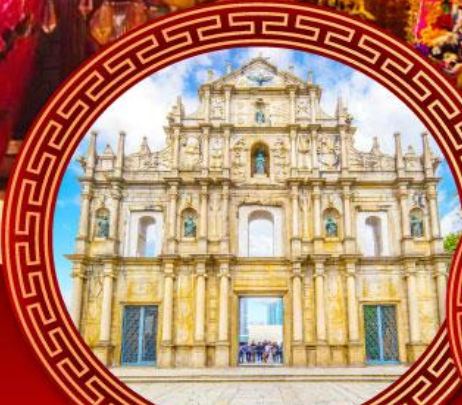
โบสถ์เซนต์ปอล