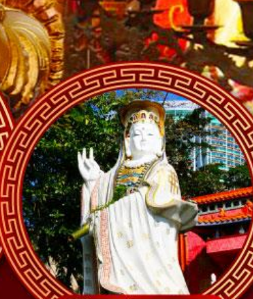
เจ้าแม่กวนอิม ริพัลส์เบย์