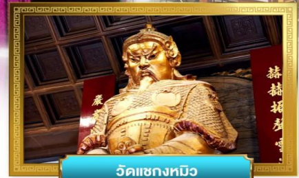
วัดเข่งหมิว