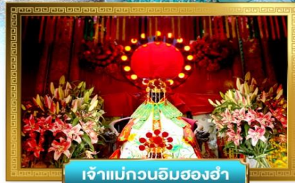
เจ้าแม่กวนอิมสองอำ