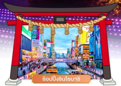
ช้อปปิ้งชินไซบาชิ

เดินทางโดยสายการบิน : ไทยแอร์เอเชียเอ็กซ์