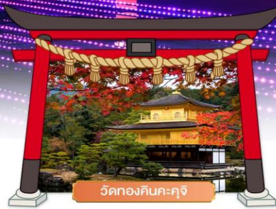
วัดคองคินคะคุจิ