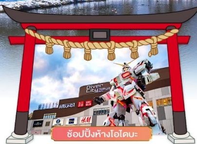
ช้อปปิ้งห้างไอโดบะ