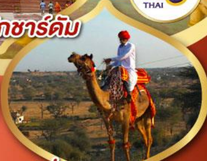
ฟรี ژیوซู เมืองมันทวา ราคาเริ่มต้น