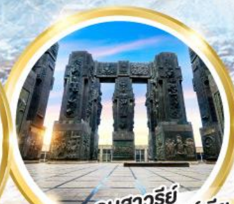
อนุสาวรีย์ประวัติศาสตร์จอร์เจีย