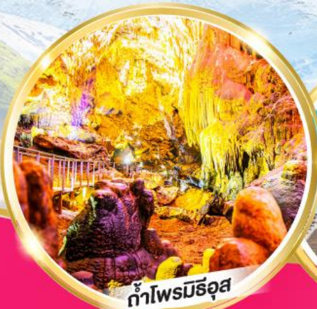
ถ้ำไฟมอร์อูส