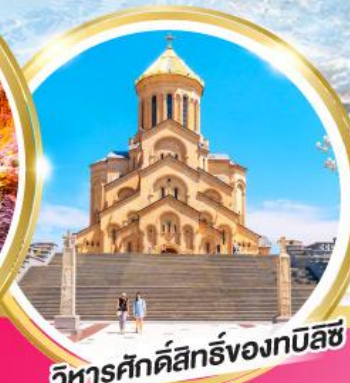
วิหารศักดิ์สิทธิ์ของทบิลีซี