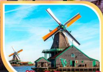
หมู่บ้านกังหันลมชานสคันส์