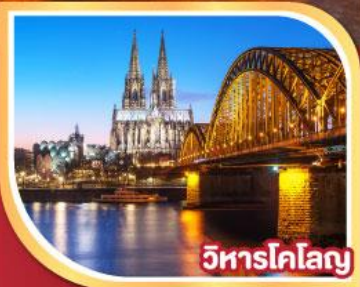
วิหารโคโลญ

28 ธ.ค. 67-04 ม.ค. 68 04-11 ม.ค. 68 18-25 ม.ค. 68 25 ม.ค.-01 ก.พ. 68