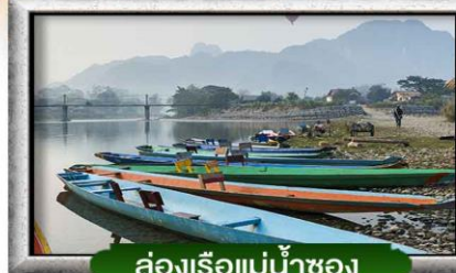
ล่องเรือแม่น้ำซอง