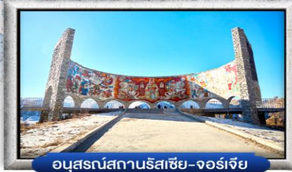
อนุสรณ์สถานรัสเซีย-จอร์เจีย