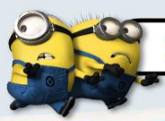
ZONE 5 : THE LOST WORLD