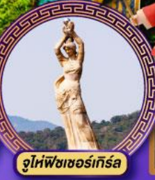
จูไห่ฟิงเซอ์เกิร์ล