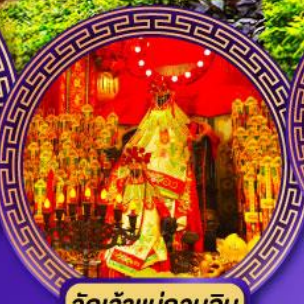
วัดเจ้าแม่กวนอิม ฮองซา