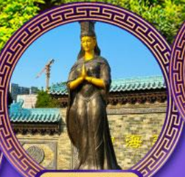
วัดเจ้าแม่ทับทิม