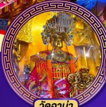
วัดอาม่า