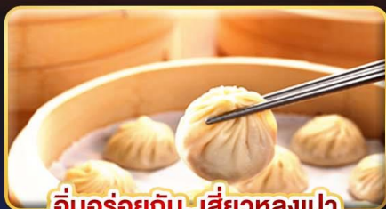
อึ้งอร่อยกับ..เสี่ยวหลงเปา

พิเศษ !! หม้อนึ่งจักรพรรดิ , ไอศกรีม MIYAHARA