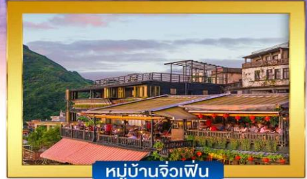
หมู่บ้านจิวเฟิ่น

พิเศษ !! หน่อเนื้อจิ๋วรสเด็ด, เสี่ยวหลงเปา ,ไอศกรีม MIYAHARA