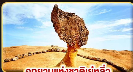
อุทยานแห่งชาติยี่หลิว