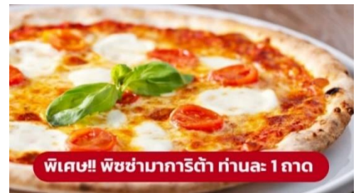
พิเศษ!! พิซซ่ามาการิตต้า ท่านละ 1 ถาด

เป็นมหาวิหารที่ใหญ่เป็นอันดับสองของโลกและรูปแบบการสร้างสถาปัตยกรรมแบบกอธิคที่ใหญ่ที่สุดในโลก มียอดแหลมบนหลังคา มากถึง 135 ยอด จนได้รับฉายาว่า "วิหารเม่น" บนยอดที่สูงที่สุดมีรูปปั้นทองขนาด 4 เมตร ของพระแม่มาดอนน่า