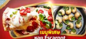
เมนูพิเศษ หอย Escargot Pizza Margherita 1 ถาด

อิตาลี มหาวิหารดูโอโม ชมสิ่งมหัศจรรย์โลก โคลอสเซียม หอเอนปิซ่า สวิส พิชิตยอดเขาจุงเฟรา "TOP OF EUROPE" สะพานไม้ชาเปล รัมปิ่นสิงโต ฝรั่งเศส เข็ควินปารีส หอไอเฟล ประตูชัย นังรถกระเช้าไฟฟ้ามงต์มาตร์ ล่องเรือแม่น้ำแซนชมเมือง ซ็อบป์ซิงแบรนต์เนมห้างปลอดภาษี เอาท์เล็ต