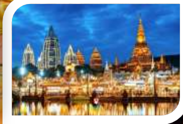
ชมโชว์สุดอลังการ