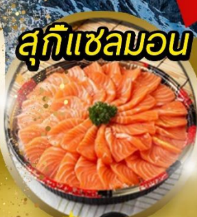
สุกี้ยะลุ่มอน