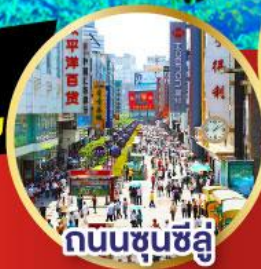
ถนนชุนชิว

-เมนูพิเศษ สุกี้หมาล่าเสฉวน , เปิดปีกกึ่ง