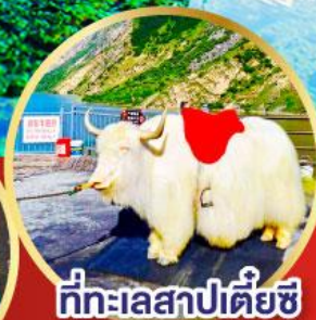
ที่ทะเลสาปเตี้ยซี