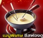
เมนูพิเศษ ชีสฟองดู

2 ยอดเขาที่สวยงามที่สุด Jungfrau และ Matterhorn รวมตัวรถไฟ Glacier Express และ Gornergrat train เมืองมอญเทร ปราสาทซิลยอง เวเวย์ รูปปั้นชาร์ลี แชปลิน โสซาน ศาลาไทย เบิร์น ลูเซิร์น สะพานไม้ชาเปล สิงโตสะอื้น ทะเลสาบสิมรกต เบลาช