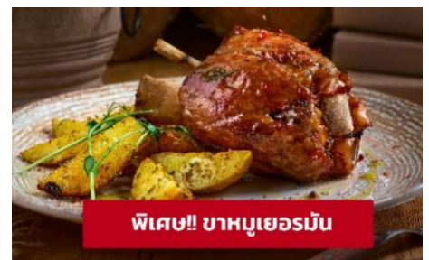
พิเศษ!! ขาหมูเยอรมัน

(ชื่อโรงแรมที่ท่านพัก ทางบริษัทจะทำการแจ้งพร้อมใบนัดหมาย 5-7 วัน ก่อนวันเดินทาง)