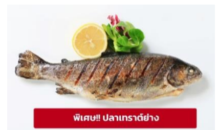
พิเศษ!! ปลาเทราต์ย่าง