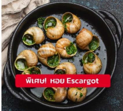
พิเศษ! หอย Escargot