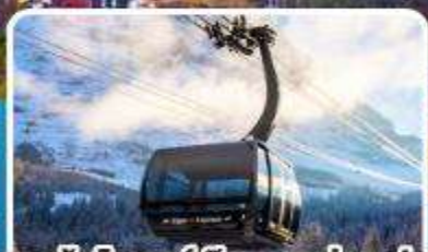
กระเช้า ไอเกอร์เอ็กสเพรส สู่อยอดเขาจุงเฟรา

อิตาลี สวิตเซอร์แลนด์ ฝรั่งเศส 10 วัน 7 คืน