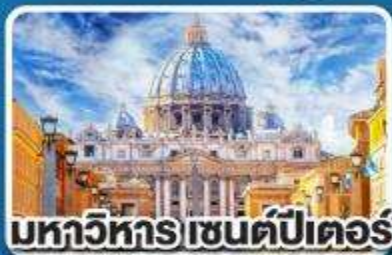
มหาวิหาร เซนต์ปีเตอร์