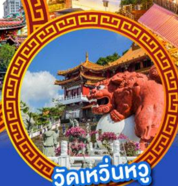
วัดเหวียนหู่