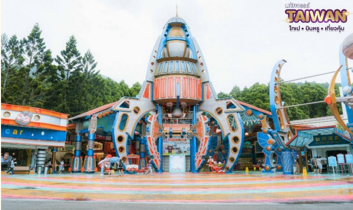
มหัศจรรย์ TAIWAN ไทเป • ซินหรง • เกี้ยวคู๋