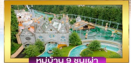
หมู่บ้าน 9 ชั้นฟ้า