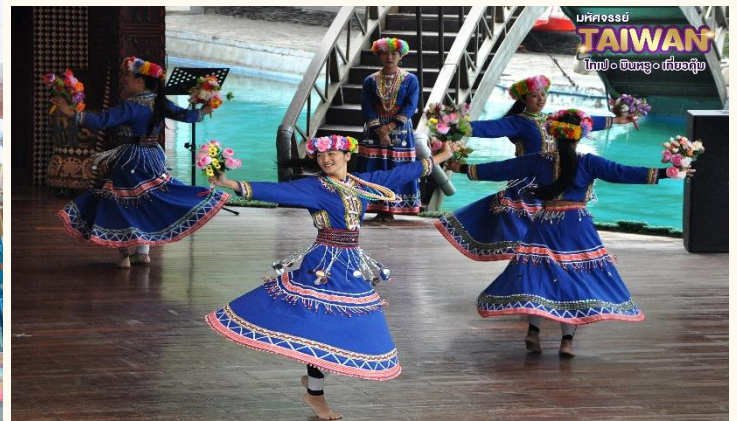
มหัศจรรย์ TAIWAN ไทเป • ซินหรง • เกี้ยวคู๋