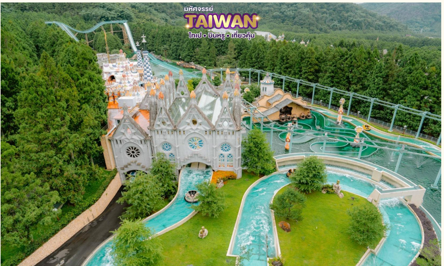
มหัศจรรย์ TAIWAN ไทเป • ซินหรง • เกี้ยวคู๋

เที่ยง ๑๑ บริการอาหารกลางวัน ณ ภัตตาคาร พิเศษ !! เมนูปลาประธนาธิบติ หลังอาหาร นำท่าน ล่องเรือชมความงามของทะเลสาบสุริยันจันทรา )SUN MOON LAKE( แหล่งน้ำจืดใหญ่ที่สุดบนเกาะ ไต้หวัน ที่มาของชื่อทะเลสาบสุริยันจันทรา มาจากทิศตะวันออกของทะเลสาบมีลักษณะคล้ายพระอาทิตย์ และ