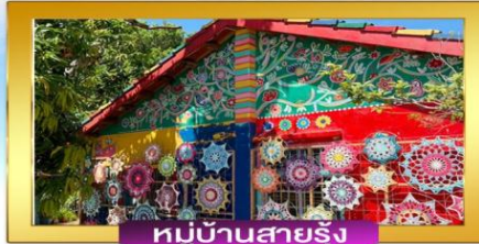
หมู่บ้านสายรุ้ง