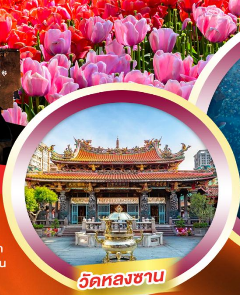
วัดทองซาน