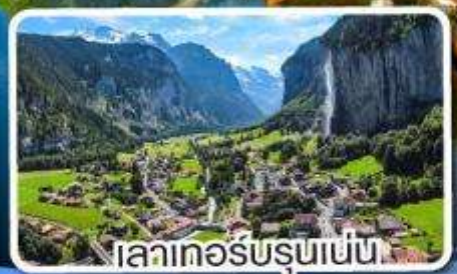
เลาเทอรับรุนเนน