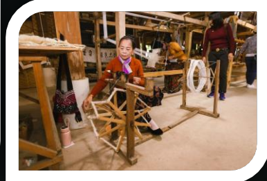
หมู่บ้านไทลื้อ