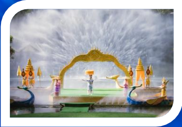
ชมโชว์สุดอลังการ

สิบสองปันนา มนต์เสน่ห์ชาวไทลื้อ ดินแดนแห่งนกยูง