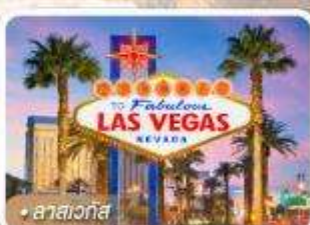
ลาสเวกัส