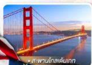
สะพานโกลเดนเกต

★ เยือนอุทยานแกรนด์แคนยอน ผัง South rim ความมหัศจรรย์ทางธรรมชาติ ที่ยิ่งใหญ่ที่สุดแห่งหนึ่งของโลก