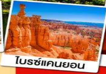
โบรซ์แคนยอน