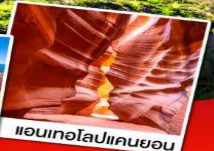
แอนเทอโลปแคนยอน