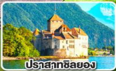
ปราสาทซิลยง