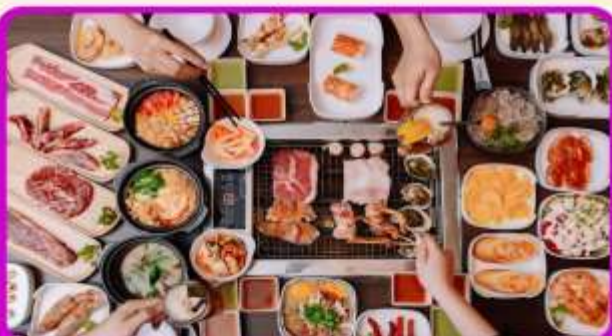
พิเศษ!! เมนูชาซีมี+บุฟเฟ่ต์ปังย่าง