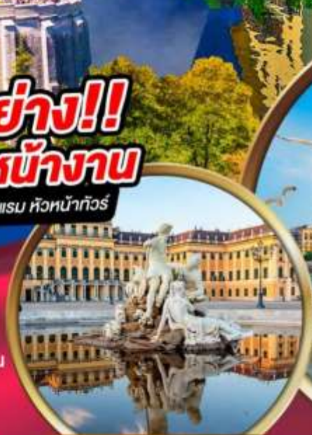
พระราชวังชินบรุนน์