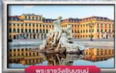
พระราชวังเซ็นบรุนน์