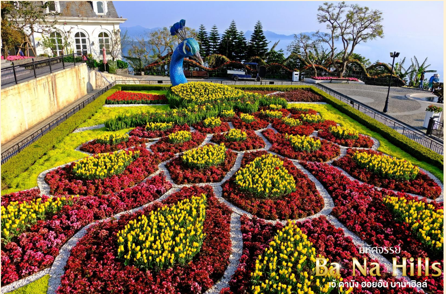
บริษัทจอร์จ Ba Na Hills เว้ คานัง ฮอยอัน บานาฮิลล์

ชมเมืองฝรั่งเศส เป็นตึกออกแบบมาได้บรรยากาศยุโรปแท้ๆแต่มาเจอได้ใกล้ๆเพียงแค่วียดนาม ลัดเลาะไปตามตรอกซอกซอย มีมุมถ่ายรูปเชิ่คอินสวยๆหลายมุม Le Jardin d' Amour เป็นสวนสวยสไตล์ฝรั่งเศส ที่มีทั้งดอกไม้ต้นไม้ มีมุมถ่ายรูปสวยๆ เต็มไปหมด รวมไปถึงมี โรงไวน์ Debay Wine Cellar อีกด้วยค่ะ เราเดินไปเที่ยวด้านในจะเป็นคล้ายๆ อุโมงค์ใต้ดินไว้บ่มไวน์ เป็นทางยาว เดินทะลุชมไปเรื่อยๆ ก็จะออกมาที่สวน นอกจากนี้ เดินไปไม่กี่ไกลยังมีพระพุทธรูปองค์ใหญ่สีขาวสูงถึง 27 เมตรอีกด้วย ให้ท่านเพลิดเพลินไปกับบานาฮิลล์ โซนใหม่ Eclipse Square ตามอัธยาศัย