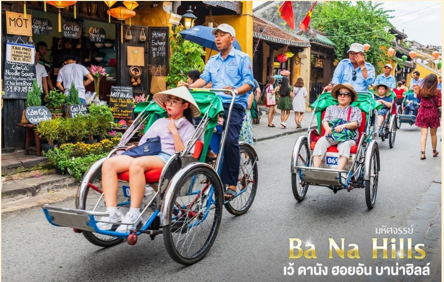
มหัศจรรย์ Ba Na Hills เว้ คานัง ฮอยอัน บาน่าฮิลล์