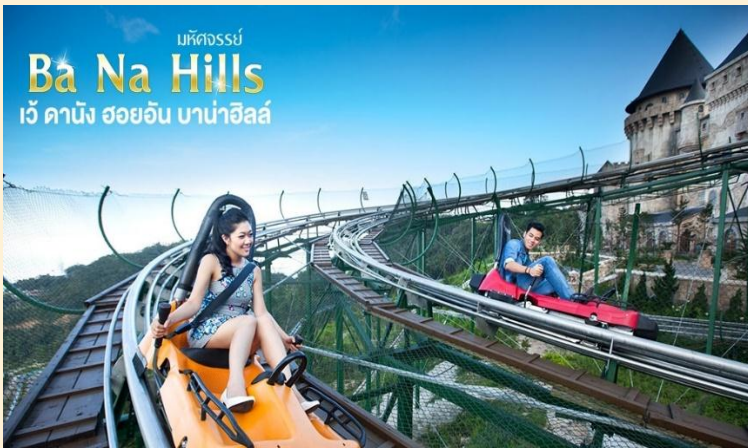
บริษัทจอร์จ Ba Na Hills เว้ คานัง ฮอยอัน บานาฮิลล์